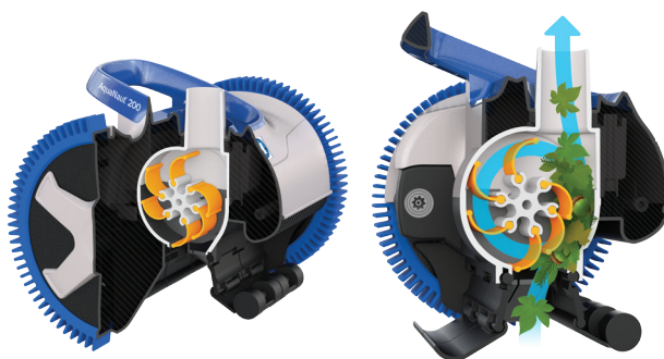
V Flex™: turbina de álabes móviles para capturar los residuos grandes