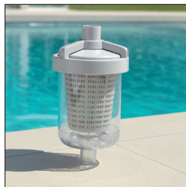
Cesta para hojas